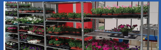
22 mei Afhaaldag Bloemenmarkt