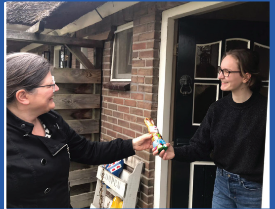
3 april Paashazen actie Jeugdcommissie