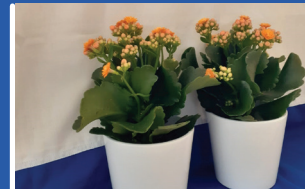
24 april Orkestleden in de bloemetjes gezet