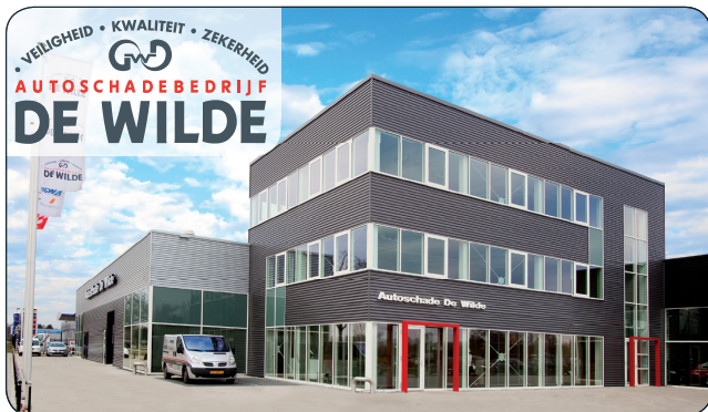
Autoschadebedrijf De Wilde Vaassen Talhoutweg 36 - 8171 MB Vaassen - Tel. 0578-576777 - Website www.autoschade-dewilde.nl