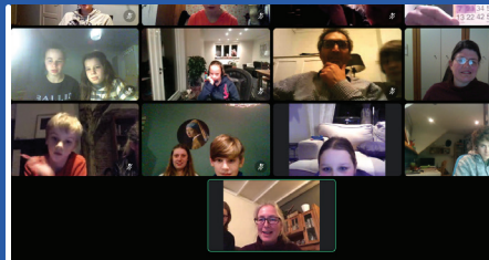
5 februari Online Bingo jeugdleden