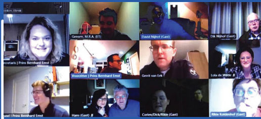
7 januari Online Nieuwjaarsbingo