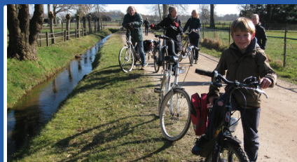
voorjaarsvakantie Fietspuzzeltocht jeugdleden