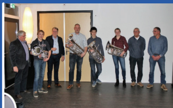
4 januari Nieuwjaarsreceptie + aanbieden nieuwe baritons