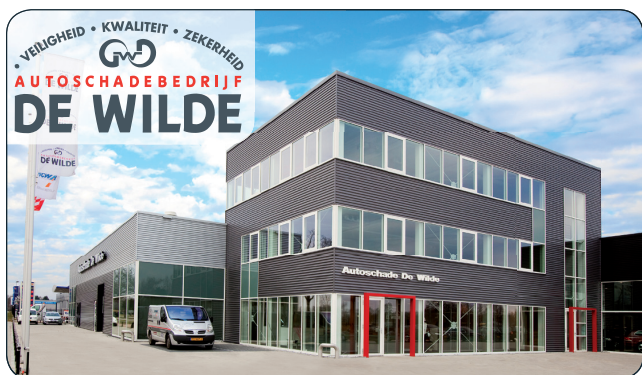
Autoschadebedrijf De Wilde Vaassen Talhoutweg 36 - 8171 MB Vaassen - Tel. 0578-576777 - Website www.autoschade-dewilde.nl