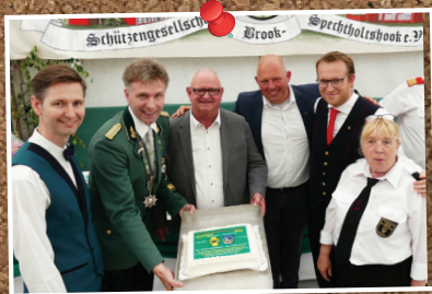
Er wordt een taart aangeboden.