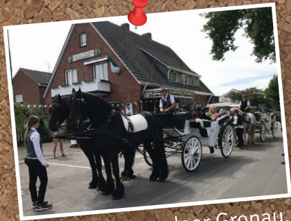
Start rondgang door Gronau.