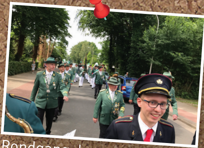
Rondgang dorp zaterdagmiddag.