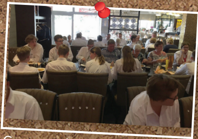
Gezamenlijk eten zaterdagavond.