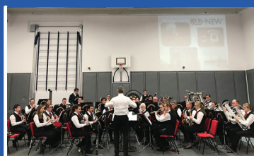
17 februari Winterconcert