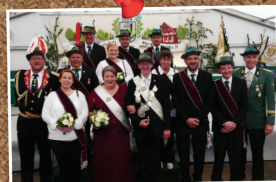
De nieuwe schutterskoning met zijn koningin.