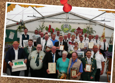
Zoek de voorzitter.