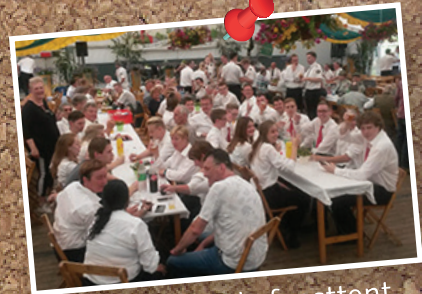
Groepsfoto in de feesttent.