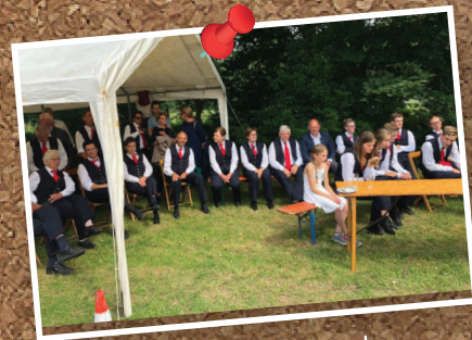
Kijken naar het optreden van Epe