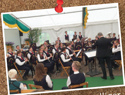
Het wordt steeds gezelliger.