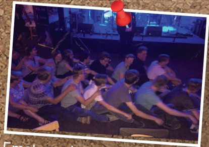
Emst maakt er een feestje van.