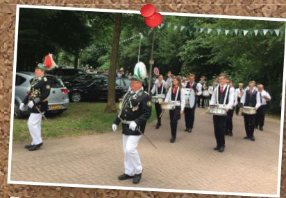
Zondagochtend vanaf de kerk naar de feesttent.