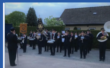
27 april Koningsdag Epe & Emst