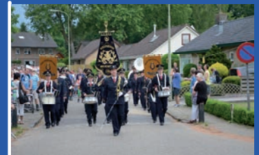
10 juni 2016 Intocht W.I.O.S. Epe