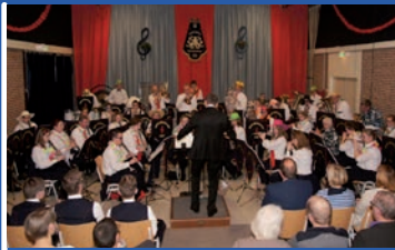
13 februari 2016 Winterconcert