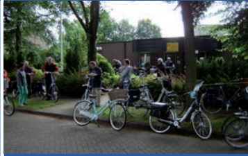
27 t/m 30 juni 2016 Avond Rijwiel Vierdaagse