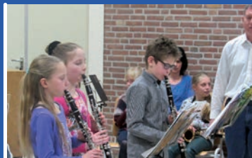
5 maart 2016 Jeugdconcert