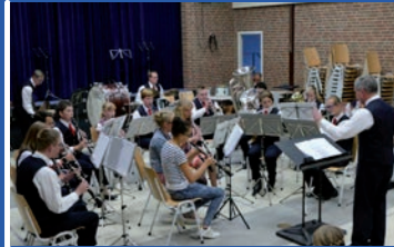
8 juli 2016 Zomeravondconcert