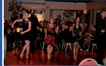
5 november 2016 Let's Dance Apeldoorn